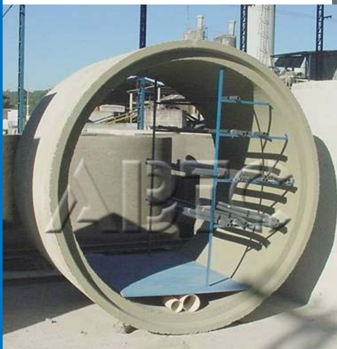
✓ Tubo de Concreto