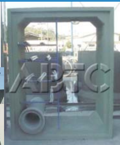
✓ Aduelas de Concreto