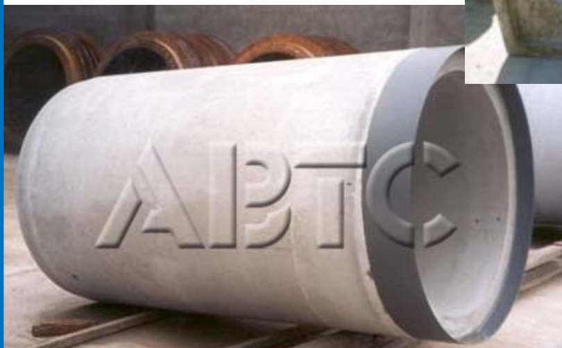
✓ Tubo de Concreto para Cravação